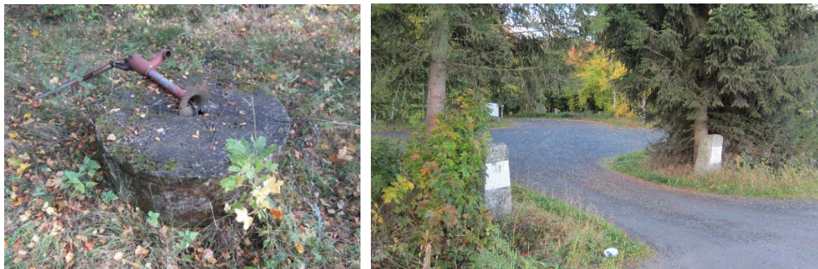
Kuva 10. Vanhan kaivon paikalla oleva uudempi kaivo ja porttikivet

Hulminpuiston alueella on Kapteenintalon ja kivijalkojen lisäksi uudempi varastorakennus sekä rakennelmia ja rakenteita eri aikakausilta. Alueella sijainneen vanhan kaivon rakenteet on korvattu myöhemmin betonirenkailla. Hulmin puiston pohjoisreunan paikoitusalueelle kuljetaan porttikivien välistä. Jokirannassa kulkee vanha kolmostien linjaus. Kapteenintalon läheisyyteen on rakennettu grillikatot, tanssilava, roskakatot sekä kaarisilta.