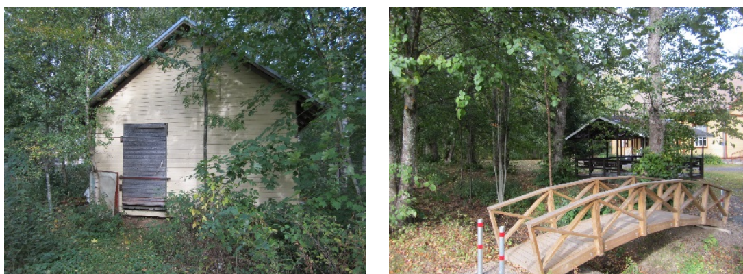
Kuva 12. Nykyinen varastorakennus ja kaarisilta, jonka taustalla tanssilava