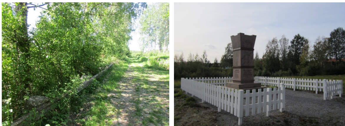
Kuva 11. Vasemmalla jokirannan vanha kolmostie ja oikealla Vapaussodan alkamisen muistomerkki vuodelta 1938