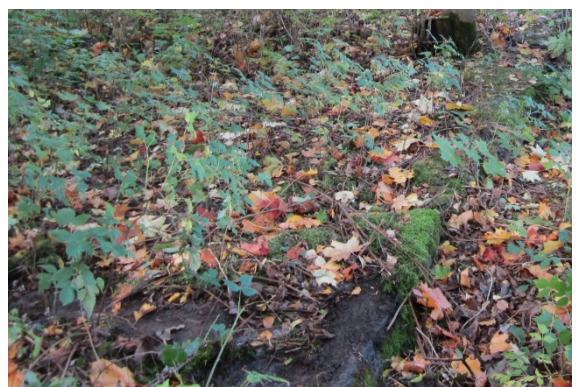
Kuva 6. Kivijalka on pääosin sammalen ja kasvillisuuden peitossa

2-kerroksinen kasarmi-/miehistörakennus rakennettiin vuonna 1883. Rakennuksen kivijalka on nykyään lähes maan tasalla ja monin paikoin sammalen ja kasvillisuuden peittämä.